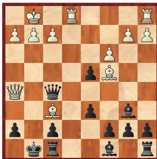
Vit vid draget, matt i två drag

Vuxenutbildningens lokaler, Norra Kungsgatan 24, vid Hoglands park på Trossö. Sal V113.