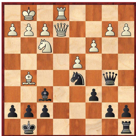
Vit vid draget, matt i två drag